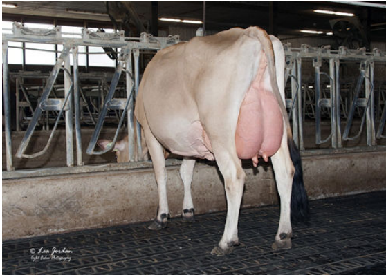
JX RIVER VALLEY ENZO MACNCHEZ 6612 {4} GRANDDAM