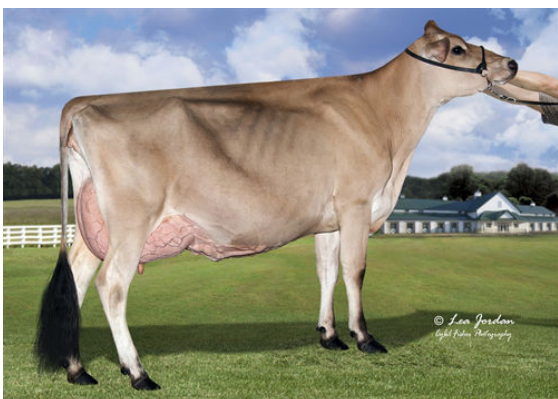
JX RIVER VALLEY ENZO MACNCHEZ 6612 {4} GRANDDAM